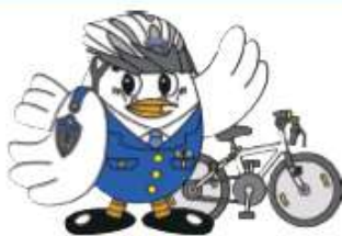
埼玉県警察マスコット「ポッポくん」

※3 自転車を運転するときは、自転車のハンドル、ブレーキその他の装置を確実に操作し、かつ、他人に危害を及ぼさないような速度と方法で運転しなければなりません。